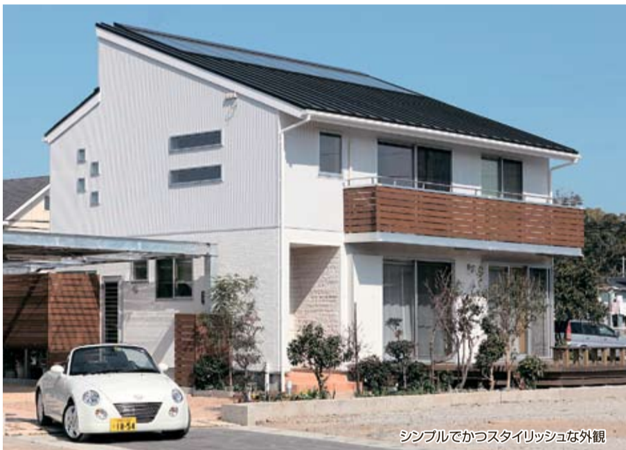
シンプルでかつスタイリッシュな外観