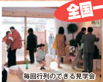
毎回行列のできる見学会

小さなお子様連れも安心。託児コーナーを設けています。この機会に、ぜひ見学会へ足をお運び下さい。