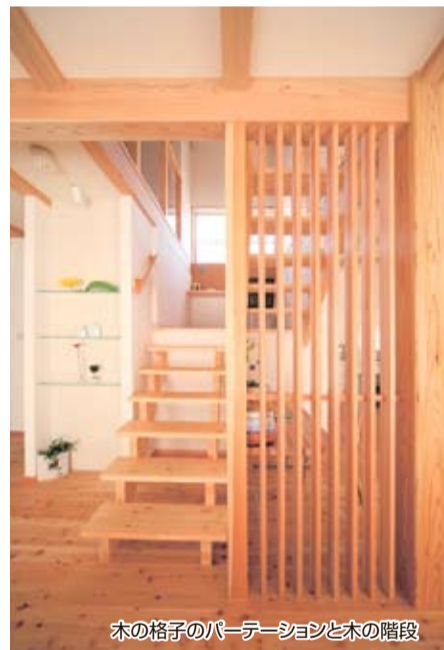
木の格子のパーテーションと木の階段