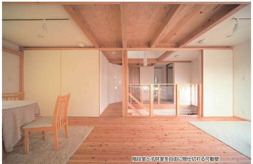
階段室と子供室を自由に間仕切れる可動壁

冬の暖かさ、夏の涼しい快適さを、実際に1日宿泊して体感してみてください。 真剣に家づくりを考えている人なら誰でもOK。くわしくはお問い合わせを。