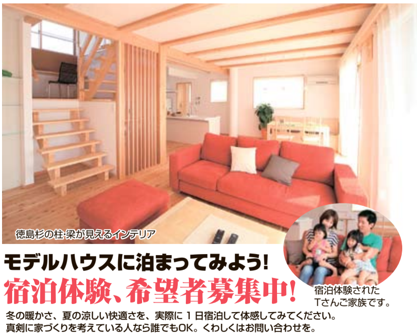
徳島杉の柱・梁が見えるインテリア